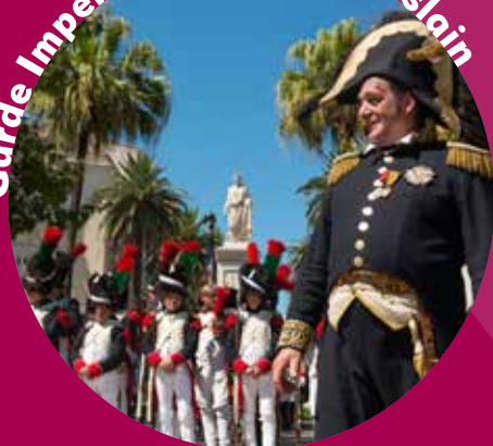
Garde Impériale de Saint Ghislain