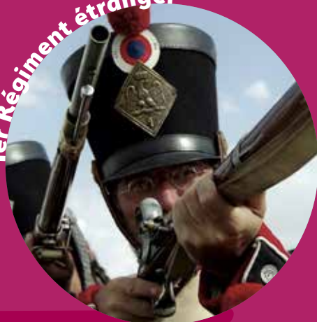
1er Régiment étranger

Notre association a pour objectif de faire découvrir la vie quotidienne des soldats des régiments étrangers, jeunes et moins jeunes, aristocrates, aventuriers français, ou prisonniers de guerre allemands, autrichiens, russes, italiens, espagnols etc. combattant en Italie et en Espagne, dans les rangs de l'armée française entre 1805 et 1814.