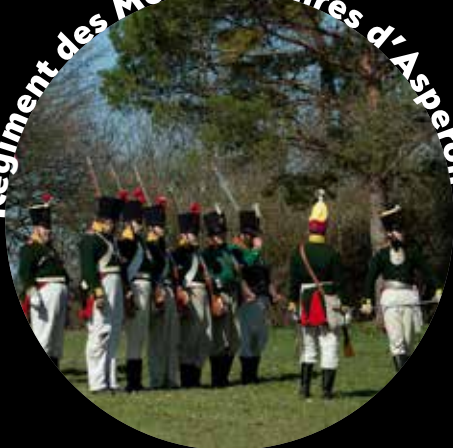
Régiment des Mousquetaires d'Asperon

Il s'agit de l'unité de reconstitution tout comme le club de l'histoire militaire qui porte le même nom. Il a été créé au début de l'an 2004. Le groupe se focalise sur la reconstitution de la bataille d'Austerlitz et à cette période, donc 1805, correspond aussi son équipement. Depuis sa fondation le régiment a participé aux divers événements autour de l'Europe et à ce jour il dispose d'un officier, d'un sous-officier et 15 soldats pleinement équipés ainsi que deux cantinières. Le groupe s'intéresse également d'autres périodes historiques comme première et deuxième guerre mondiale.