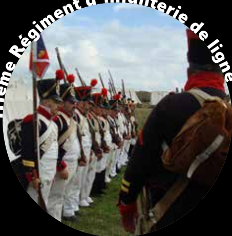
111ème Régiment d'infanterie de ligne

Le groupe historique a été fondé à Turin en 1992 par les amateurs d'histoire napoléonienne dans le but de maintenir la mémoire de ce qui s'est passé et de revivre l'expérience de la vie contemporaine, en reconstruisant des uniformes, des objets et les batailles. En 2002, le 111ème a célébré le dixième anniversaire de la création du groupe et en même temps les deux cents années de Fondation historique du régiment en 1802. En 2011, l'Association a été formée afin de donner une continuité à la précédente activité associative organisationnelle de TROIS PIQUETS. Le groupe est actuellement basé à Turin.