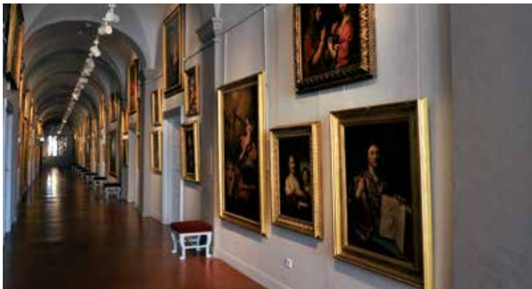
Le plus important en France, après le Louvre, pour les peintures italiennes

Plein tarif : 8€ Tarif réduit : 5€ Palais Fesch Musée de Beaux Arts 50 rue Cardinal Fesch 20000 Ajaccio Tél. : 04 95 26 26 26 www.musee-fesch.com