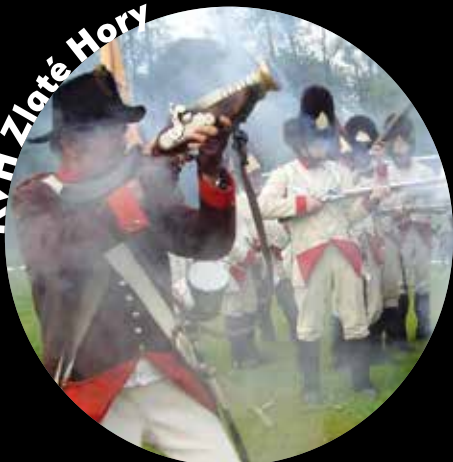
KVH Zlaté Hory

Le régiment porte le nom K u K Infanterie Regiment L.J. M von Daun No 59 en l'honneur du Marechal Leopold Joseph Maria von Daun. Ce groupe voyage un peu partout en Europe depuis sa création en 1996 et, jusqu'à présent, a participé en uniformes de grenadiers autrichiens à plus que 340 batailles.