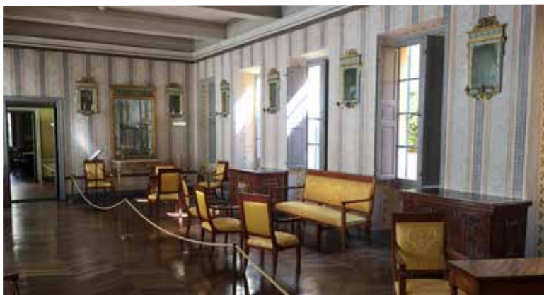
Durée de la visite : 1h.

*Sous réserve de modification. Possible majoration lors des expositions temporaires.