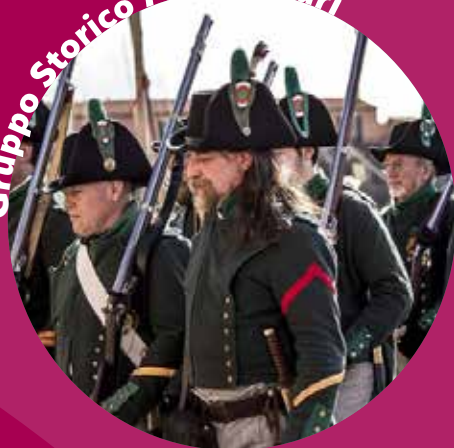
Gruppo Storico Montichiari

Le but de l'association est la reconstitution historique et la recréation de l'image fidèle et correcte des uniformes, des camps militaires, des armes, des commandes et des manœuvres des troupes qui ont pris part à l'époque Napoléonienne et du Risorgimento Italien.